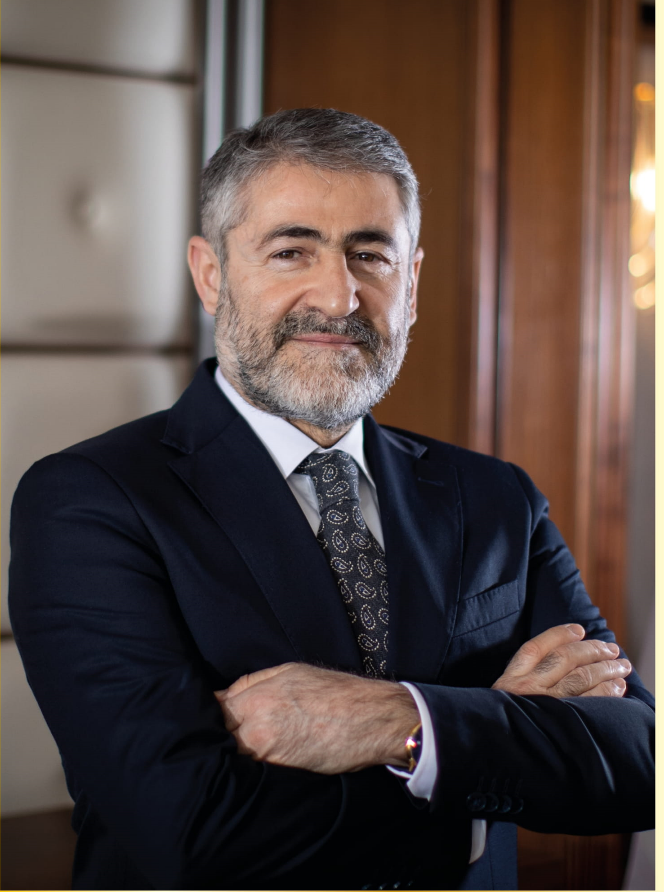
Dr. Nureddin NEBATİ | Hazine ve Maliye Bakanı