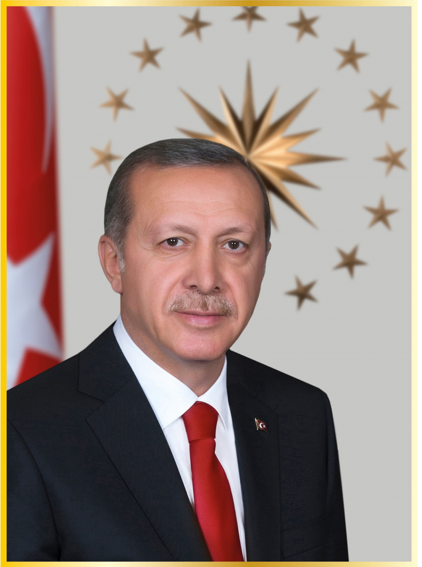
Recep Tayyip ERDOĞAN | Türkiye Cumhuriyeti Cumhurbaşkanı