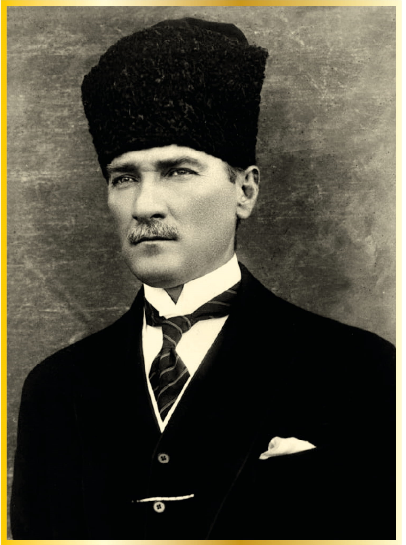
Gazi Mustafa Kemal ATATÜRK